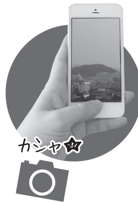
③空を撮影して送信!