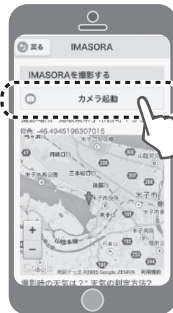
②「カメラ起動」を選択